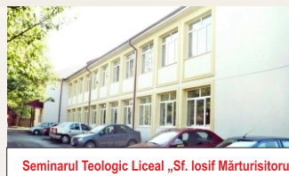
Seminarul Teologic Liceal „Sf. Iosif Mărturisitorul”