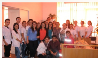
Sală de demonstrație