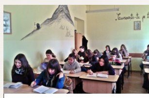
Sală de clasă

...Stau de vorbă cu cei care învață aici!