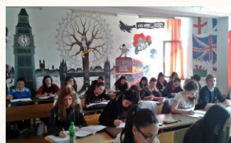
Cabinet Limba engleză