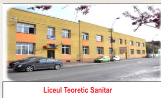
Liceul Teoretic Sanitar