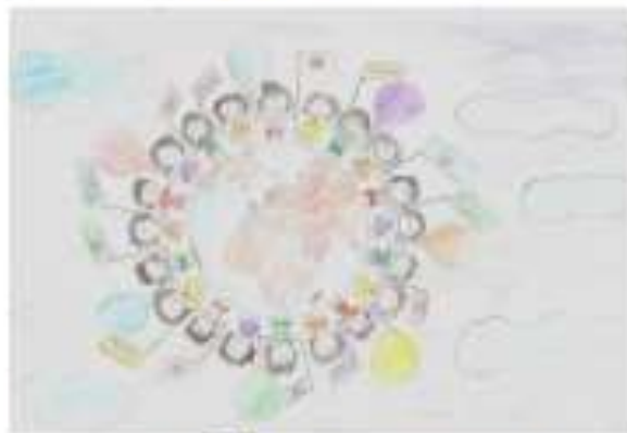
IONIȚĂ ALEXANDRU IONUȚ