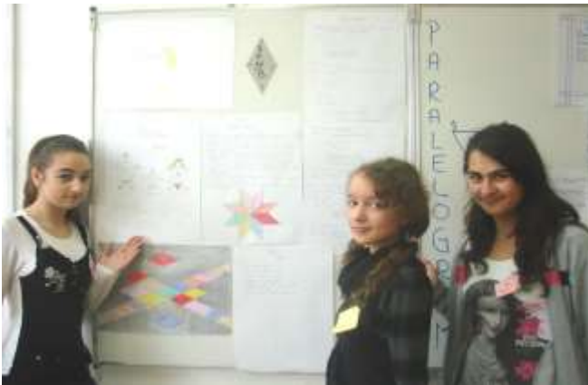
Elevi din clasa a VII-a B An scolar 2010-2011

Invatarea matematicii prin proiecte realizate de elevi: