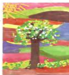
IONIȚĂ ALEXANDRU IONUȚ