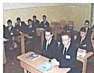
Sala de clasa