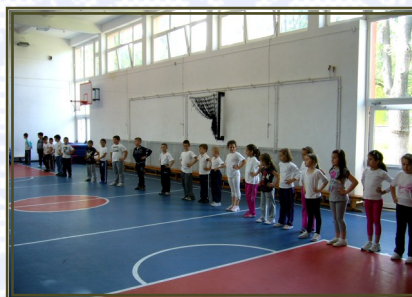
SALA DE SPORT