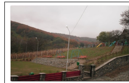
Terenul de sport