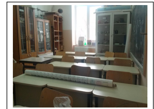
Laborator de fizică- chimie