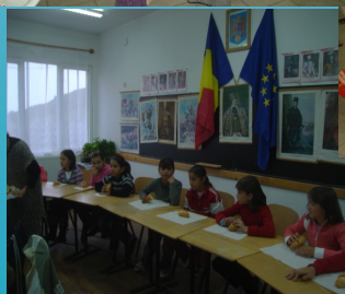
Parteneriat—Școala Primară Belin-Vale și Școala nr. 31 Brașov