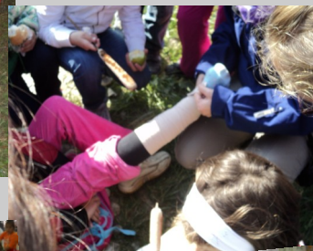
Proiectul "Natura, sursă de sănătate"