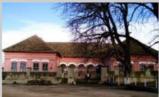
Școala cu clasele I-IV Belin

Activitățile educative la nivel primar și gimnazial se desfășoară în trei clădiri separate.