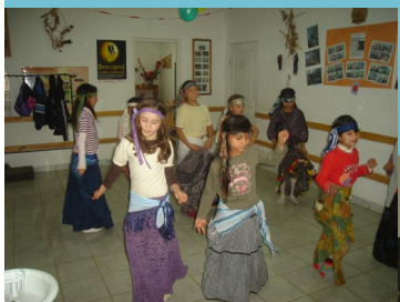
Activitate interculturală—Școala primară Belin-Vale