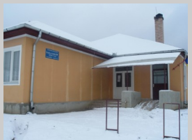
Școala cu clasele I-IV Belin-Vale