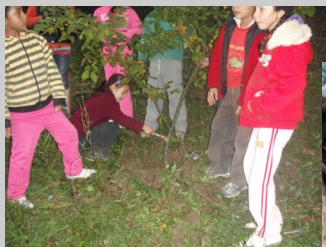
Halloween la grădiniță