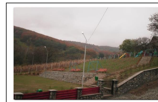
Terenul de sport