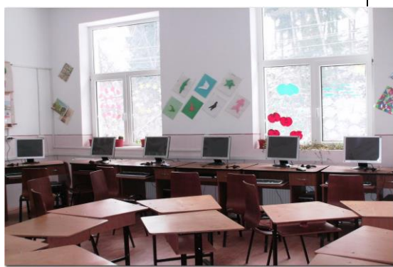
Laborator de informatică