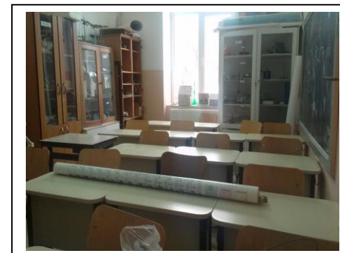
Laborator de fizică- chimie