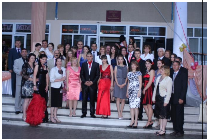
Colectivul profesoral al