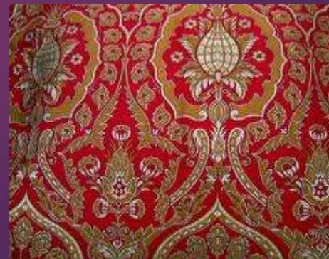
Brocart, Lyon 1760-1770