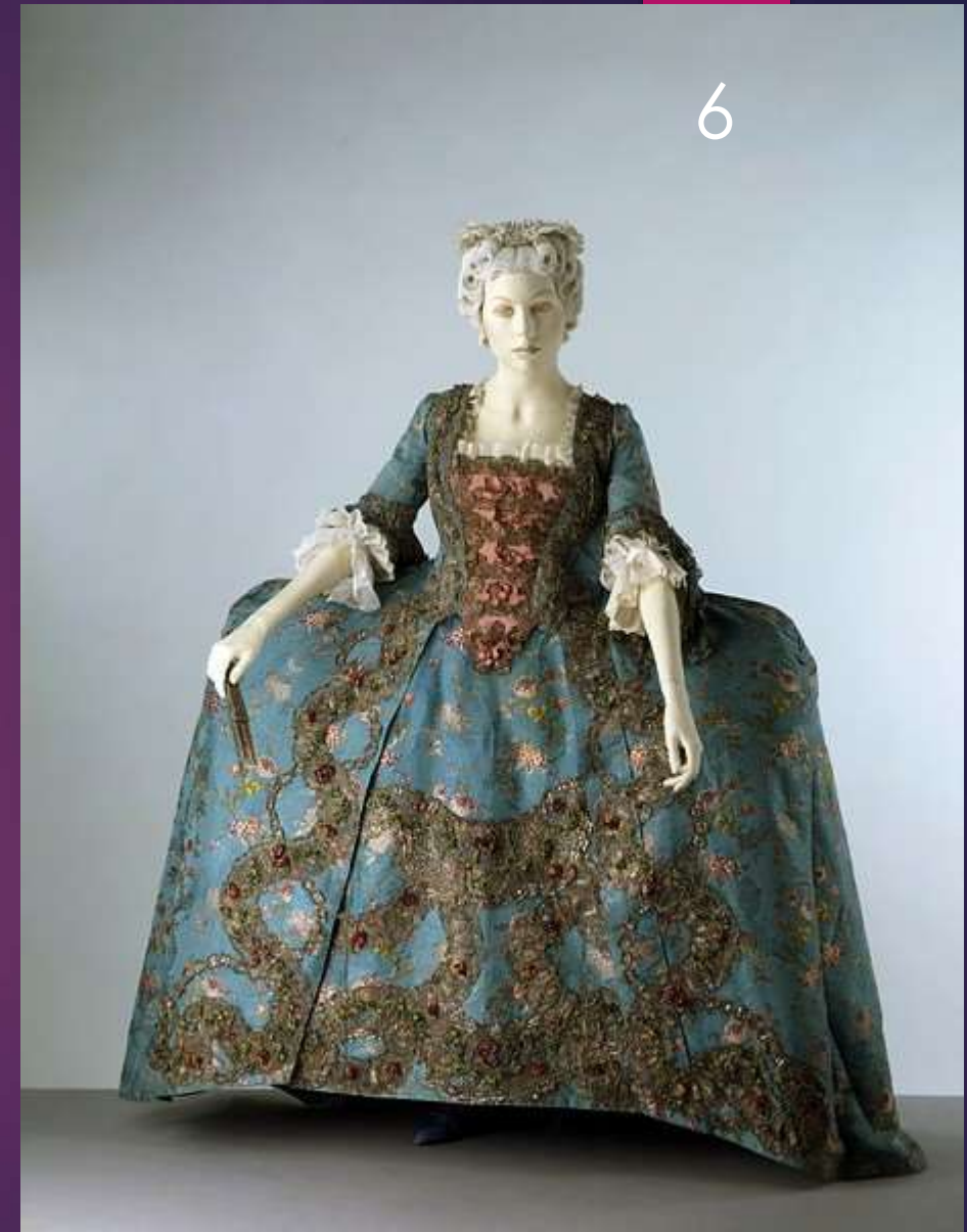
Stilul baroc - secolul XVII