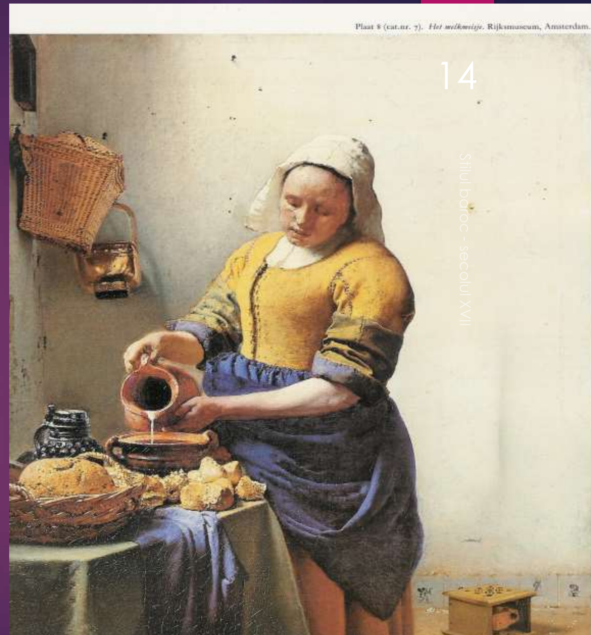
The Milkmaid by Johannes Vermeer

Pe trup, cămașa era vizibilă la guler și la manșete, gulerul era fie bărbătesc, cu sau din dantelă, fie ca o pelerină plată din pânză transparentă.