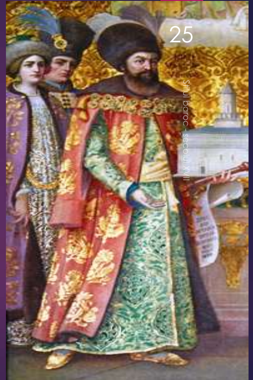
Stilul baroc - secolul XVII

În picioare papuci, iar pentru călărie cizme.