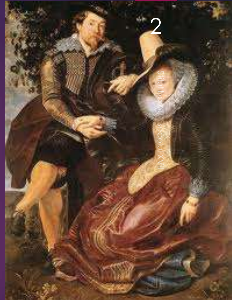
P.P.Rubens, Autoportret cu Isabella Brant, 1609-1610, München, Alte Pinakothek

Forma dominantă era cea a valului mării, a flăcării sau a crengii care crește în S cu volute inegale.