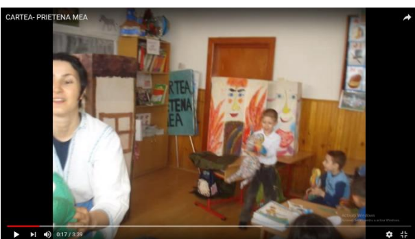
Piese de teatru în sala de clasă- "Punguța cu doi bani", "Fata babei și fata moșneagului", după Ion Creangă, "Baba Dochia" ș.a.)- activități desfășurate în cadrul Proiectului educativ județean " Cartea- prietena mea "- https://www.youtube.com/watch?v=GK_-a8MGWSM