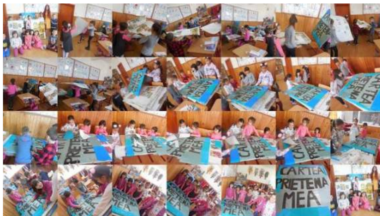
"Cartea Uriașă" - Clasa Pregătitoare B- Școala Gimnazială "Ion Creangă" Buzău

În cursul lunii iunie, va avea loc premiarea colectivelor de elevi, a cadrelor didactice și a bibliotecarilor implicați în proiect.