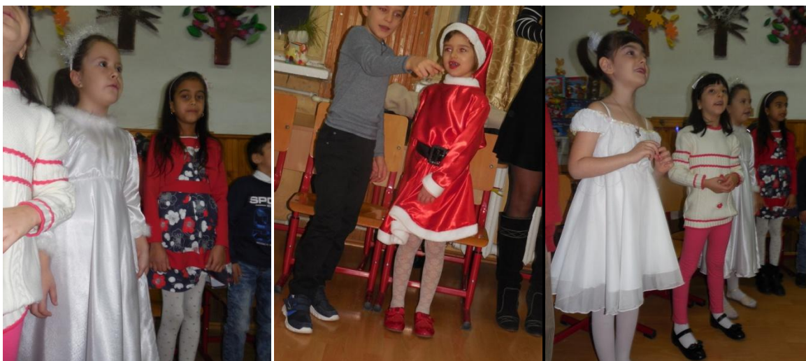
Serbare de Crăciun- Clasa Pregătitoare B, Școala Gimnazială "Ion Creangă" Buzău- decembrie 2017

Prin conținutul bogat și diversificat al programului pe care îl cuprinde, serbarea școlară valorifică varietatea, preocuparea intereselor și gusturilor școlărilor. Ea evaluează talentul, munca și priceperea colectivului clasei și transformă în plăcere și satisfacție publică străduințele colectivului clasei și ale fiecărui copil în parte.