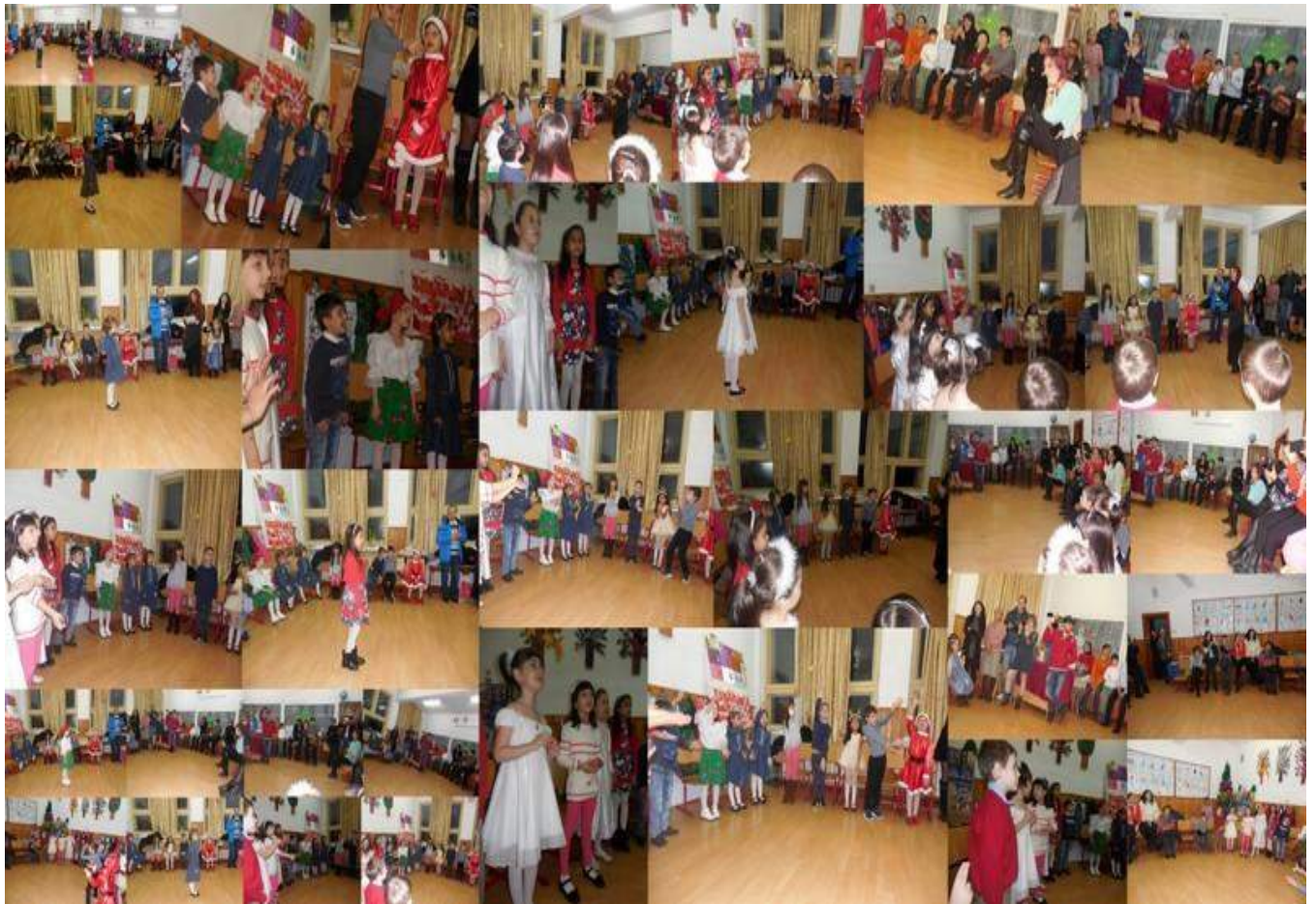
Serbare de Crăciun- Clasa Pregătitoare B, Școala Gimnazială "Ion Creangă" Buzău- decembrie 2017