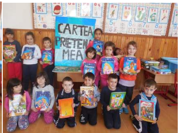
"Cartea Uriașă"- Clasa Pregătitoare B- Școala Gimnazială "Ion Creangă" Buzău