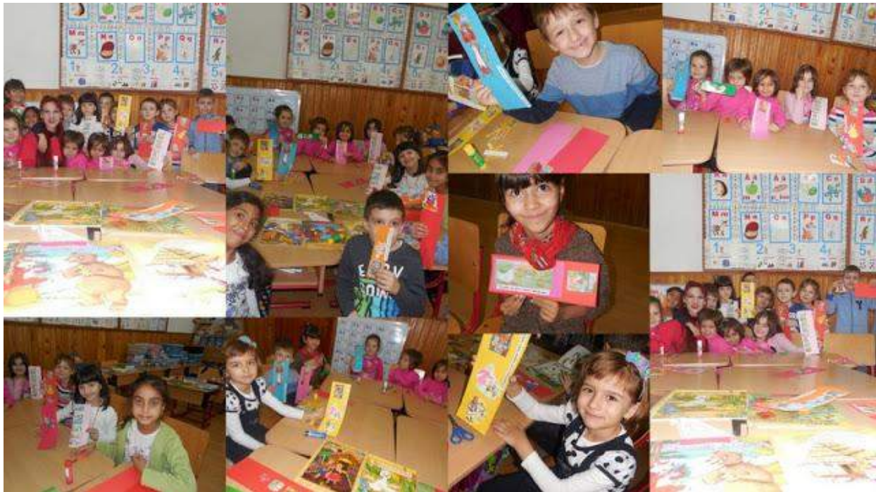
"Cartea în viața cotidiană- da sau nu?"- Activitatea nr.2- în cadrul Proiectului educativ județean "Cartea- prietena mea"- Clasa Pregătitoare B- Școala Gimnazială "Ion Creangă" Buzău