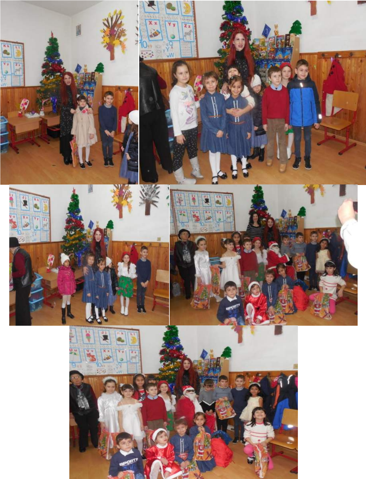
Serbare de Crăciun- Clasa Pregătitoare B, Școala Gimnazială "Ion Creangă" Buzău- decembrie 2017