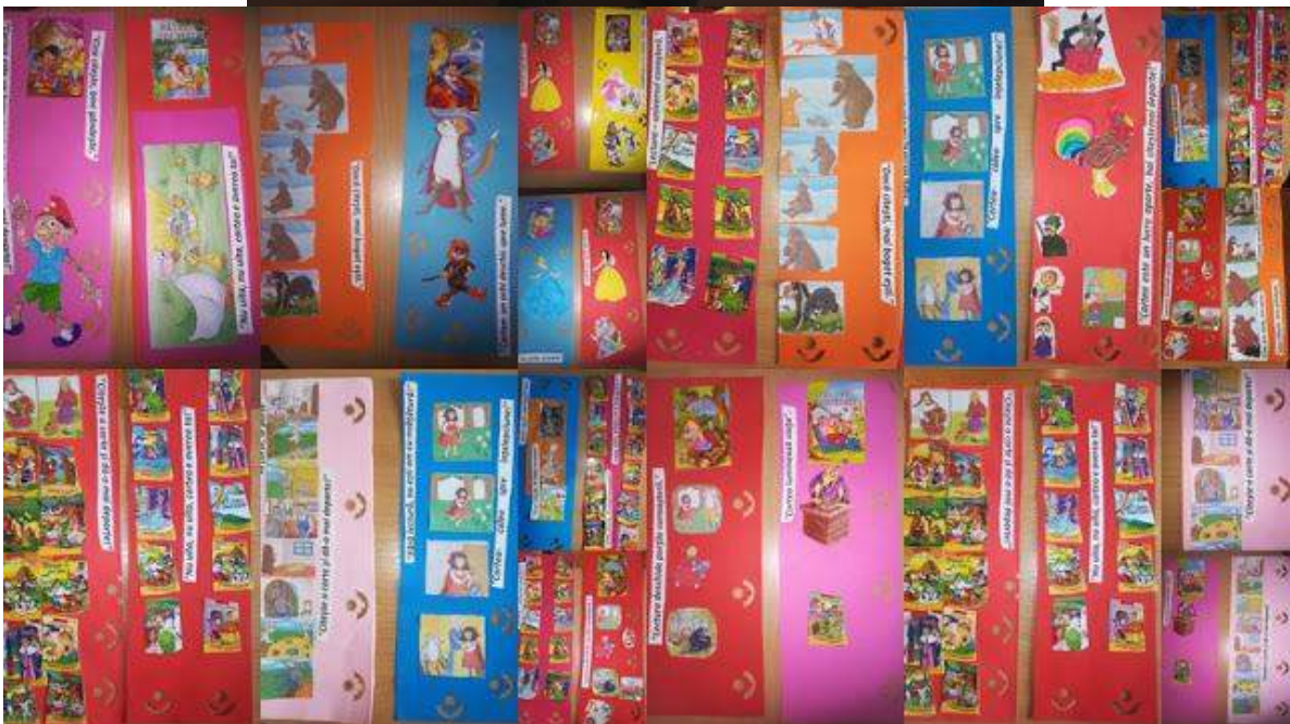
"Cartea în viața cotidiană- da sau nu?"- Activitatea nr.2- în cadrul Proiectului educativ județean "Cartea- prietena mea"- Clasa Pregătitoare B- Școala Gimnazială "Ion Creangă" Buzău