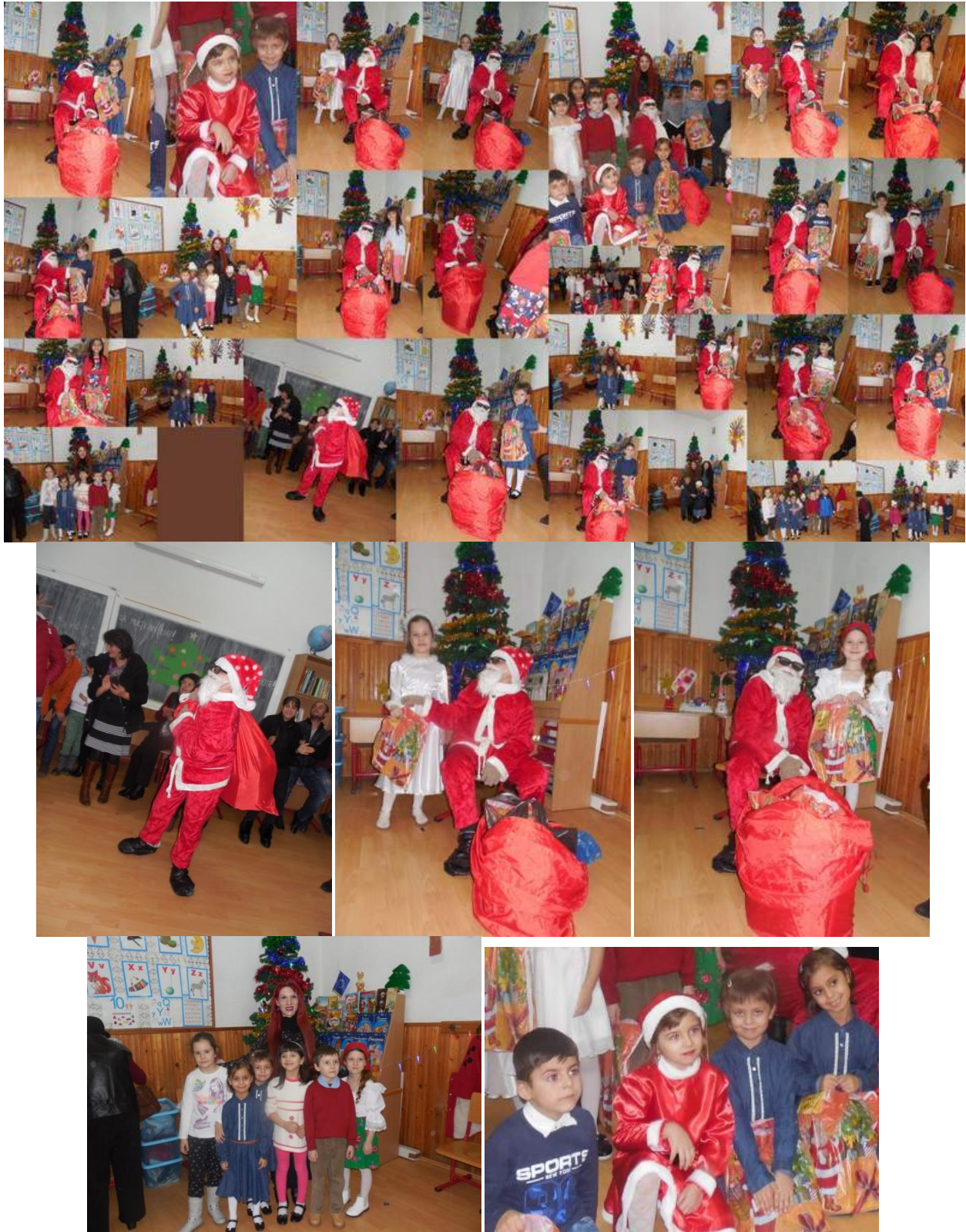
Serbare de Crăciun- Clasa Pregătitoare B, Școala Gimnazială "Ion Creangă" Buzău- decembrie 2017