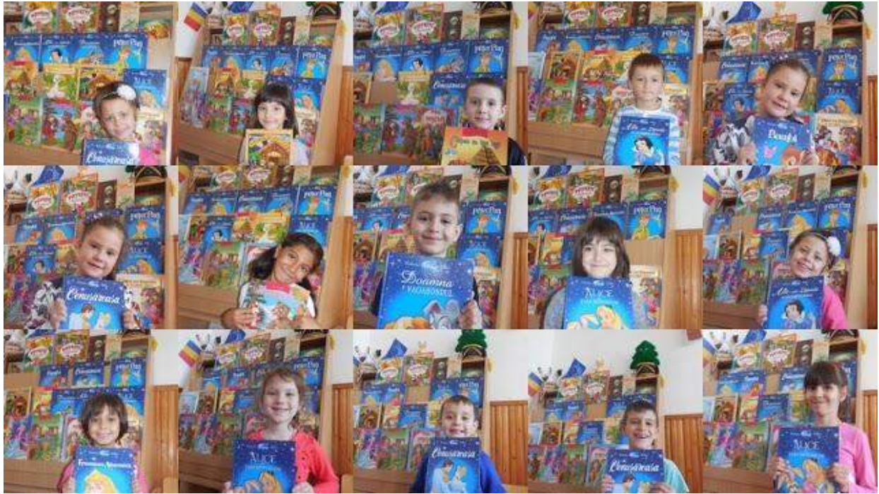
"Prezentare de carte"- Clasa Pregătitoare B- Școala Gimnazială "Ion Creangă" Buzău