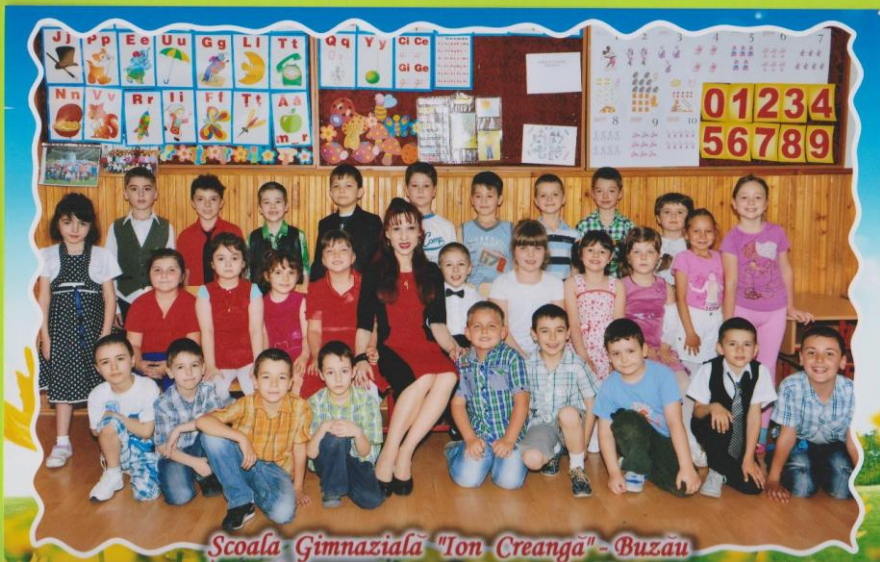
Scoala Gimnazială "Ion Creangă" - Buzău